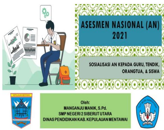
Gambar 2. Sosialisasi ANBK

ANBK ke dalam slide powerpoint pada gambar di bawah ini.