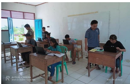
Gambar 3. Pelaksanaan Penggunaan komputer

Siswa SMP Negeri 2 Siberut Utara berpendapat bahwa dengan adanya pelatihan penggunaan dan pengenalan perangkat komputer sangat membantu mereka dalam menghadapi ANBK. Siswa menyebutkan dengan adanya pelatihan secara rutin maka mereka akan terbiasa ketika berada di hadapan komputer dan tidak merasa canggung dalam menggunakan komputer. Proses pelatihan yang dilaksanakan dapat dilihat pada gambar 2 berikut ini.