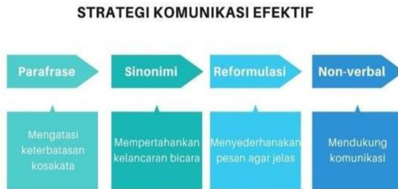
Gambar 2. Strategi Komunikasi Efektif Berdasarkan Dell Hymes

Dari sudut pandang pragmatik, strategi komunikasi sangat berkaitan dengan kemampuan mempertimbangkan kondisi interaksi. Pembicara efektif mampu menyesuaikan tingkat formalitas, menggunakan penanda kesantunan ( politeness strategies ), memperhatikan hierarki sosial, serta menghindari potensi kesalahpahaman. Penelitian pragmatik menunjukkan bahwa strategi seperti hedging , mitigation , dan politeness markers dapat mengurangi konflik dan meningkatkan penerimaan pesan dalam interaksi interpersonal maupun profesional. Ketika strategi ini tidak digunakan, komunikasi cenderung bersifat kaku dan kurang responsif terhadap kebutuhan audiens.