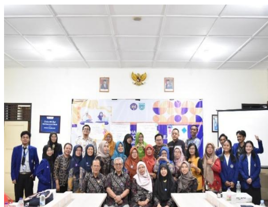
Gambar 2 Tim PPM Dosen Dan Mahasiswa Serta Peserta Pelatihan

Acara terakhir adalah refleksi terkait kegiatan yang dilaksanakan pada hari pertama dan dilanjutkan dengan arahan untuk kegiatan pada pertemuan kedua yang akan dilaksanakan secara online. Untuk persiapan pertemuan berikutnya, peserta diminta untuk merancang pembelajaran bahasa Jerman menggunakan PjBL berbasis SDGs yang disesuaikan dengan kondisi sekolah masing-masing. Tugas ini merupakan tugas individu untuk masing-masing peserta. Produk yang dihasilkan oleh peserta pelatihan adalah PPT rancangan proyek dan video. Setelah peserta menerima materi pada pertemuan pertama pada tanggal 6 September 2024, peserta diberikan waktu selama 14 hari untuk menyiapkan PPT rancangan proyek dan pembuatan konten video, yang akan dipresentasikan pada pertemuan kedua yang dilaksanakan pada 20 September 2024.