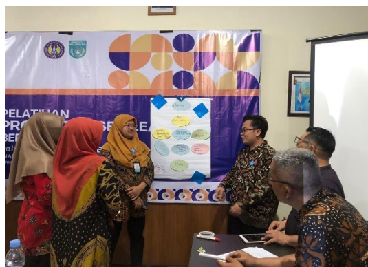
Gambar 1 Peserta Mempresentasikan Hasil Rancangan Proyek Kelompoknya

menjadi topik utama dalam program PKM kali ini.