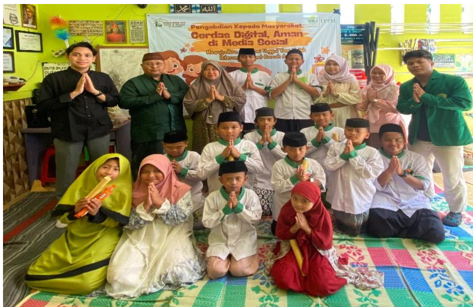
Gambar 3. Pelaksanaan Pengabdian Masyarakat Di Yayasan Yatim Dan Dhuafa Al-Jannah, Tangerang Selatan

Inisiatif-inisiatif tersebut menunjukkan bahwa program literasi digital ini tidak hanya memberikan dampak pada tataran individu, tetapi juga mendorong terjadinya perubahan pada tingkat struktural dan kultural dalam lingkungan pengasuhan anak-anak. Hal ini sejalan dengan pandangan Sanusi (2023) dan Silitonga et al. (2023), yang menekankan bahwa literasi digital berbasis komunitas idealnya membangun budaya digital yang kolektif tidak hanya meningkatkan keterampilan teknis, tetapi juga membentuk sistem nilai bersama yang dapat menopang perilaku digital yang etis dan produktif.