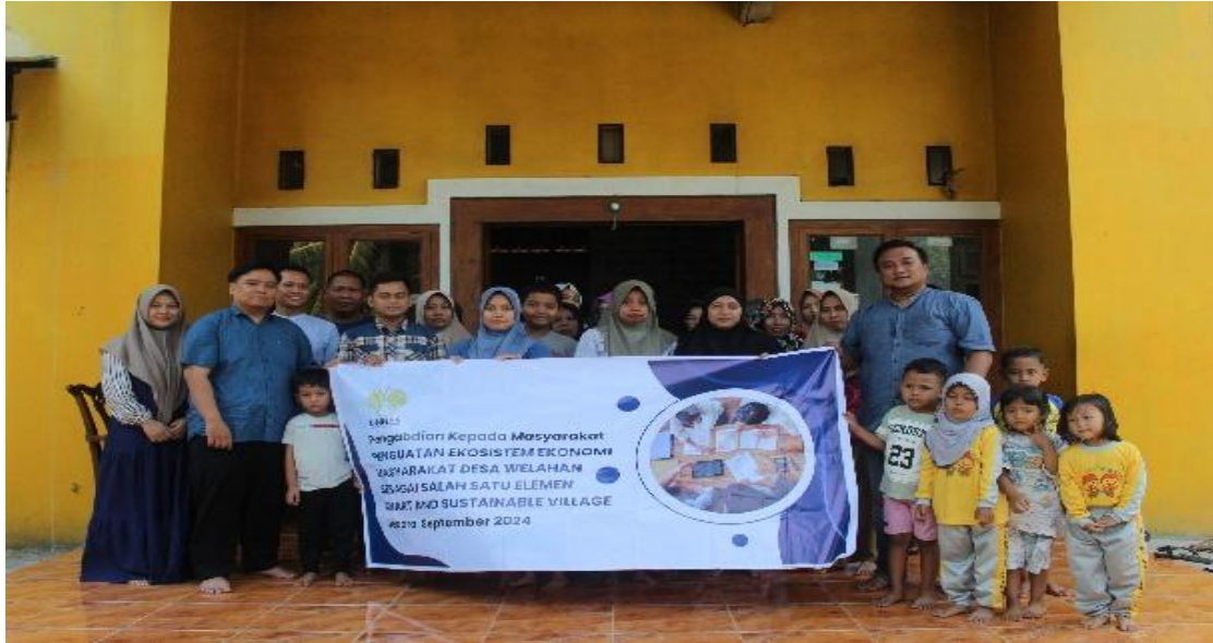
Gambar 2. Dikumentasi pelaksanaan kegiatan pengabdian.

Peserta yang datang memiliki latar belakang usia yang bervariasi, namun umumnya berada dalam usia produktif, yaitu antara 25 hingga 45 tahun. Hal ini menunjukkan adanya potensi besar dari segi motivasi dan semangat untuk meningkatkan daya saing usaha mereka. Beberapa peserta bahkan memiliki rencana untuk segera menerapkan ilmu yang didapat di lapangan, terutama pada pengolahan limbah kulit durian menjadi lilin.