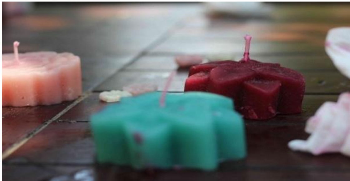
Gambar 5. Produk lilin dari limbah kulit durian.

Di sisi sosial, pelatihan ini juga membantu mempererat jaringan antar pelaku UMKM. Banyak peserta yang mulai bekerja sama, baik dalam hal produksi maupun pemasaran lilin hasil olahan mereka. Kerja sama ini menciptakan iklim usaha yang lebih dinamis di desa tersebut (Zakia, 2023).