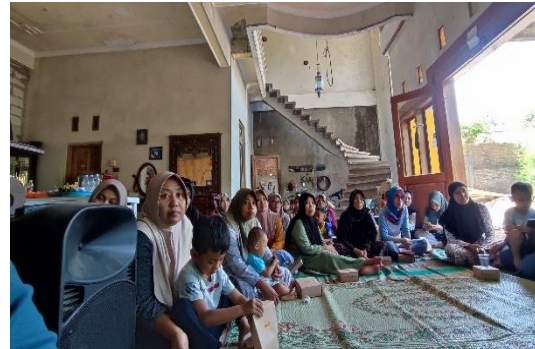
Gambar 5. Antusiasme peserta pelatihan studi kelayakan usaha.

Secara umum, hasil ini menunjukkan bahwa pendekatan yang dilakukan dalam pengabdian masyarakat ini sudah tepat, meskipun pendampingan lebih lanjut masih diperlukan untuk memastikan bahwa hasil pelatihan dapat diterapkan secara optimal oleh semua peserta.