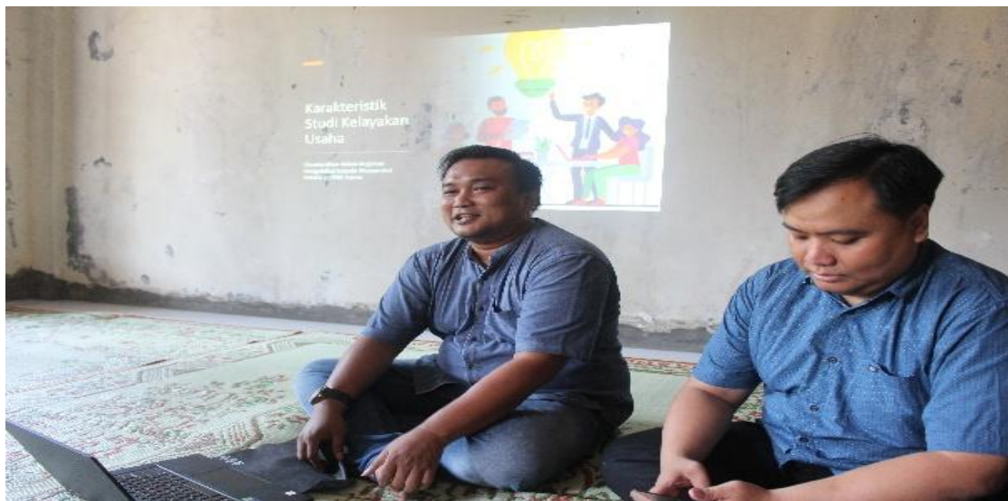
Gambar 3. Penyampaian materi studi kelayakan usaha.

Selain pelatihan pembuatan lilin, pelatihan studi kelayakan usaha juga mendapatkan respons yang positif dari peserta. Melalui pre-test dan post-test yang diberikan sebelum dan setelah pelatihan, terlihat bahwa pemahaman peserta meningkat secara signifikan di berbagai aspek usaha, terutama terkait analisis pasar, perencanaan keuangan, strategi penerapan keuangan dan evaluasi kelayakan usaha. Pada pre-test dan post test ini, terdapat 10 pertanyaan yang harus dijawab oleh peserta pelatihan. Dari