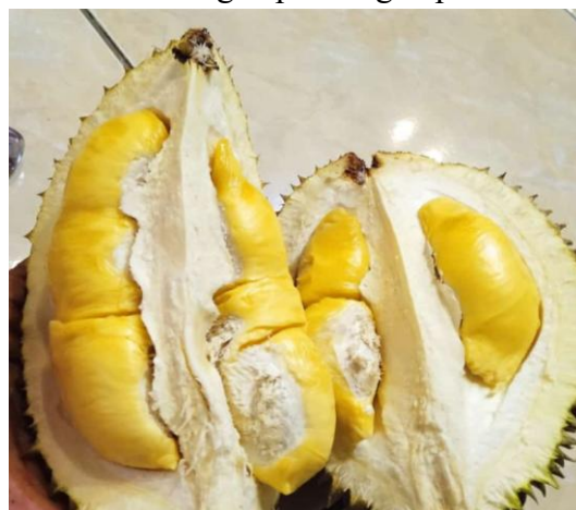
Gambar 1. Durian hasil Ervin Duren.

pada kegagalan bisnis atau sulitnya bertahan di tengah persaingan pasar.